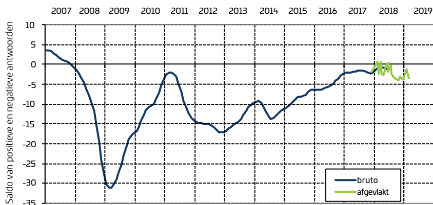
Figuur 1: synthetische conjunctuurcurve voor West-Vlaanderen